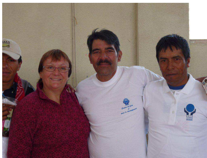
avec les partenaires du Red Kuchub'al au Guatemala, à Sibinal.