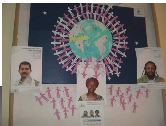
A Baix, le panneau des vœux