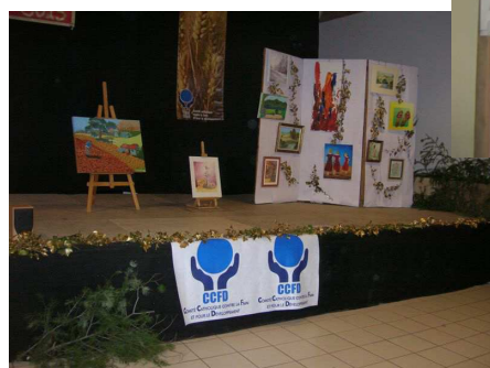
À Antraigues La fête pour la solidarité Les tableaux pour la tombola