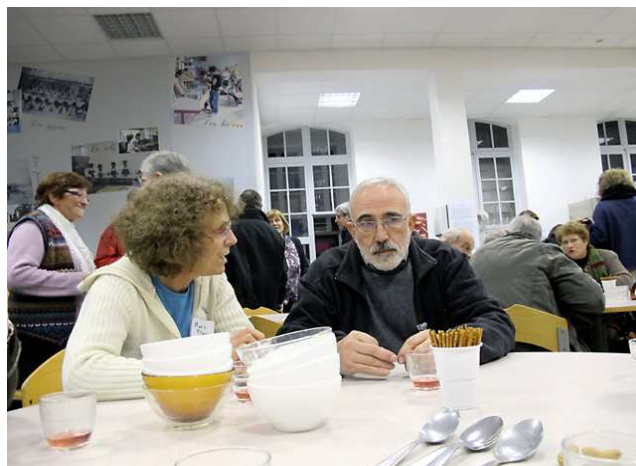
Après la soupe