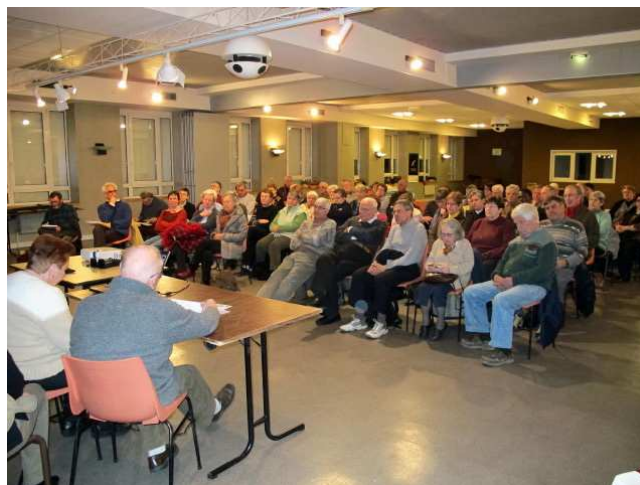
Entrée en carême 2012 à St Vallier