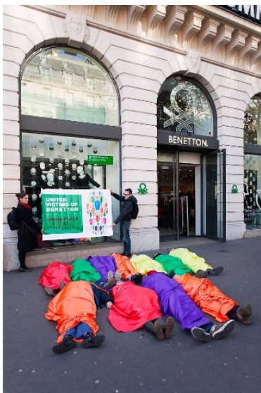
Rana Plaza « action Benetton »

Dans l'Hérault, dès 2011, nous avons créé une première alliance avec le groupe local d'Oxfam-France et le Secours Catholique pour la campagne « Stop Paradis fiscaux ». Cela a permis aux 3 associations de mener ensemble la campagne du Pacte pour une terre solidaire au moment des élections législatives de 2012. Puis nous nous sommes rendu compte qu'il nous fallait élargir cette alliance et nous avons créé le collectif 34 « Régulation et Transparence des entreprises » après l'effondrement du Rana Plaza le 24 avril 2013. Vous vous en souvenez certainement : c'était un immeuble dans lequel travaillaient 4000 ouvriers et ouvrières du textile dont 1138 sont morts sous les décombres. Plusieurs mois après le drame, un salarié du CCFD-Terre Solidaire et la coordinatrice du Collectif Éthique sur l'étiquette se sont rendus dans la capitale bangladaise pour enquêter. Une documentariste de France 5 les a suivis dans leur enquête et a réalisé un film « les damnés du low cost ». Avec ce collectif, nous avons mené de nombreuses actions :