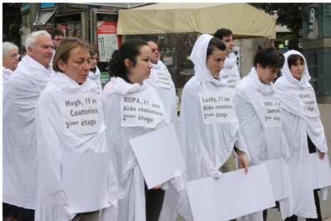
Les « 1 an » du Rana Plaza

Au niveau de la Déléation Diocésaine 34, le plaidoyer était inexistant aussi j'ai accepté la mission qui m'a été confiée : référente plaidoyer. J'ai très vite réalisé qu'il fallait jouer la carte du collectif car c'est bien lorsque nous travaillons avec d'autres associations que nous sommes plus forts. Le CCFD-Terre Solidaire a toujours eu la volonté de créer des alliances ou de s'intégrer dans différents collectifs qui travaillent comme lui sur les causes du mal-développement. C'est pourquoi, j'ai représenté la DD 34 dans plusieurs collectifs comme l'Assemblée montpelliéraine des États Généraux des migrations, MAJIE (Montpellier accueil jeunes isolés étrangers) mais principalement dans le collectif 34 « Régulation et Transparence des entreprises » que le CCFD-Terre Solidaire a créé avec le collectif Éthique sur l'étiquette, avec le groupe local d'Oxfam France et Attac.