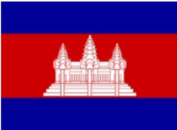
Drapeau du Cambodge