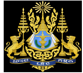
Armoiries de Cambodge

Le Royaume du Cambodge « Pays des Khmers », est un pays d' Asie du Sud-Est . La capitale du royaume est Phnom Penh