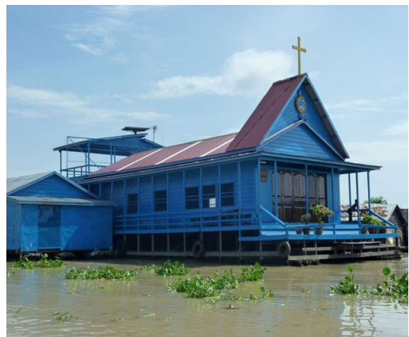
Église Catholique Flottante