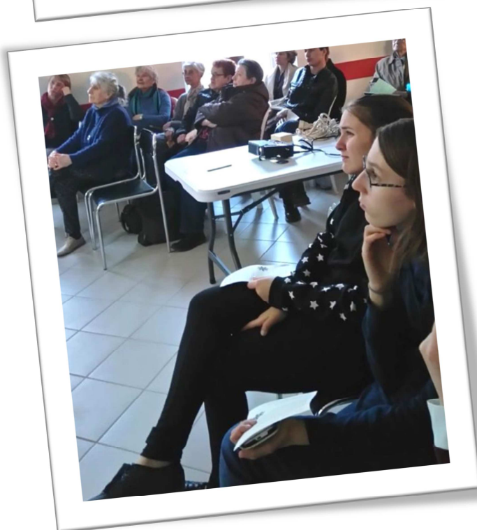
Soirée témoignage/échanges et bol de riz organisée par les jeunes de l'aumônerie à Vatan