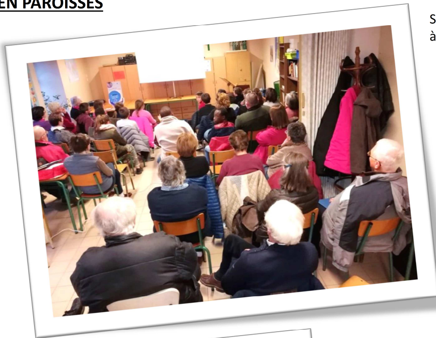
Soirée témoignage/échange et bol de soupe à Levroux