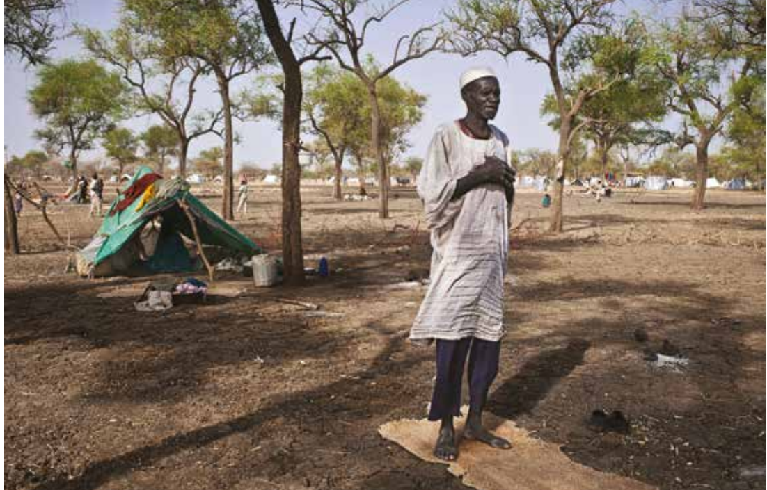
Cécile Carbière © Agence WJ / CCFD-Terre Solidaire