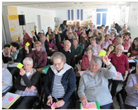
Assemblée régionale à Blois le 7 octobre