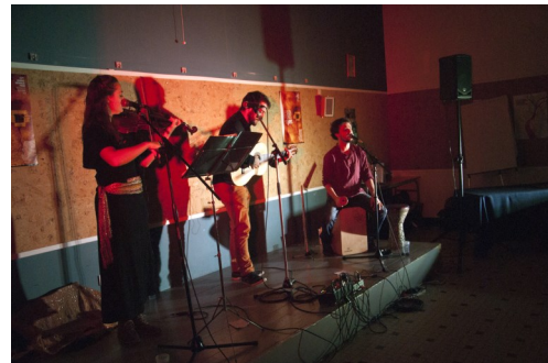
concert de musique russe/tsigane