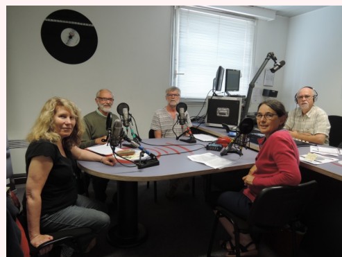
Photo 2015/2016 : depuis, l'équipe s'est réduite à trois personnes... On embauche !

Elle est toujours à écouter le jeudi des semaines paires à 19h sur 101.5 FM et en podcasts pendant plusieurs mois sur radio-g.fr