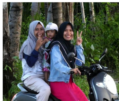
Des jeunes pleins de projets.