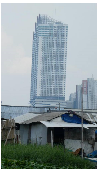
Des contrastes très forts.