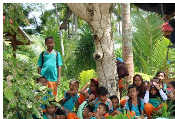
Une adaptation à la modernité. La volonté de voir les jeunes se former, faire des études, avec une grande lucidité quant aux risques de les voir partir du village. Une conviction : « certains reviennent ».