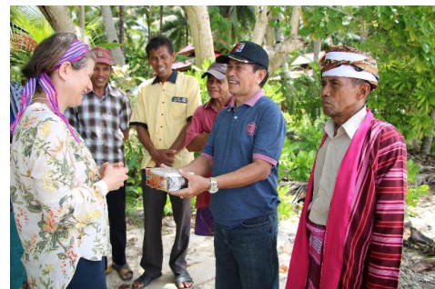
Des personnes ouvertes au partage de leur vie, de leurs expériences.