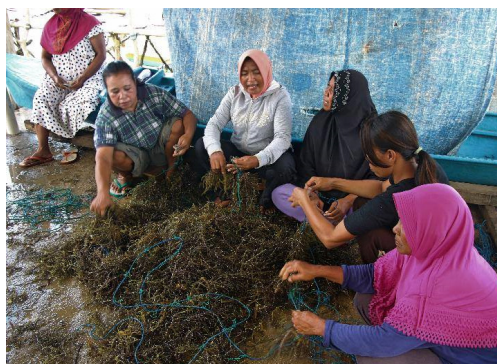
Des personnes qui se battent pour garder leur droit de cultiver, de pêcher - Des coutumes ancestrales qui permettent de préserver la ressource de poissons - Un prélèvement à la nature de ce dont ils ont besoin pour vivre et pas plus - Le respect des traditions riche et parfois pesant.