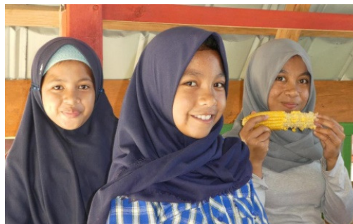
Des visages souriants, accueillants.