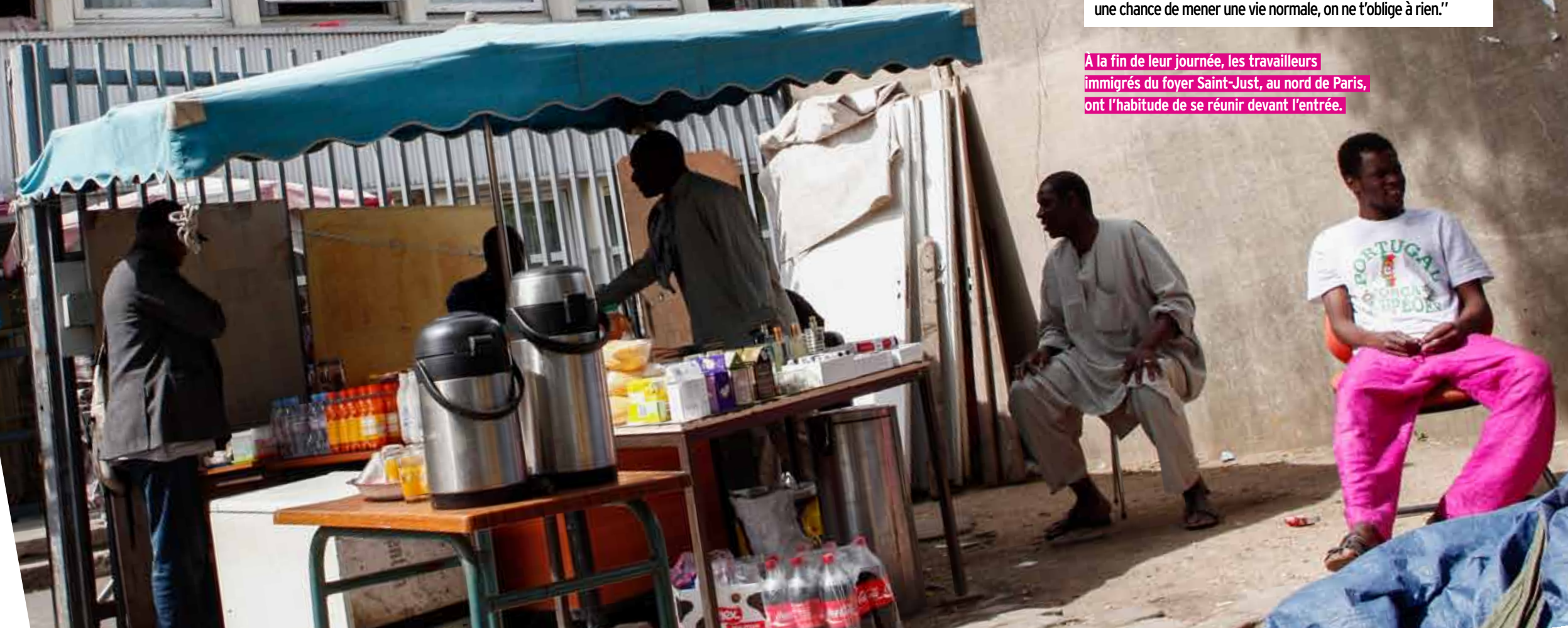
A la fin de leur journée, les travailleurs immigrés du foyer Saint-Just, au nord de Paris, ont l’habitude de se réunir devant l’entrée.