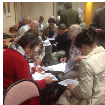
Les bénévoles décortiquent les liens du CCFD avec l'association REJA

Acteur de développement et de solidarité internationale, le CCFD-Terre solidaire s'engage avec des organismes et des associations (les sociétés civiles du Sud et de l'Est) dans un processus de changement dans la société afin d'agir sur les causes qui expliquent les pauvretés et l'injustice.