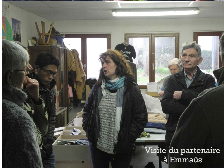
Visite du partenaire à Emmaüs