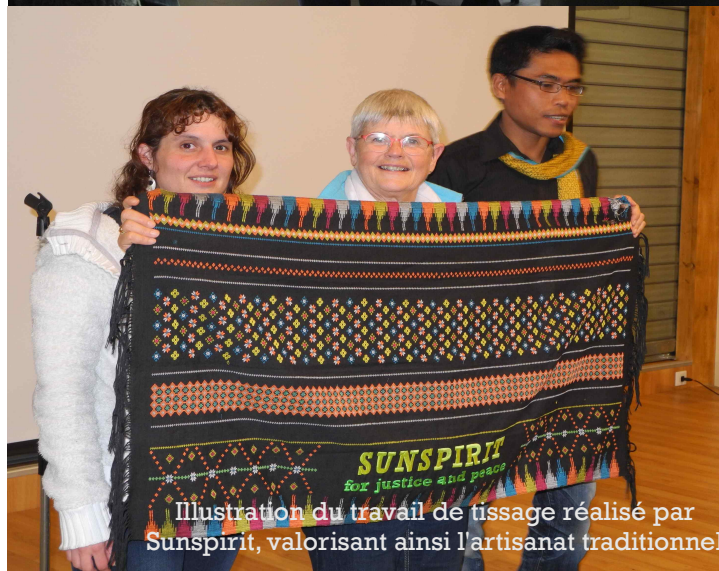
Illustration du travail de tissage réalisé par Sunspirit, valorisant ainsi l'artisanat traditionnel