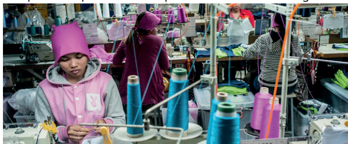
Les ouvriers et ouvrières du textile se sont mis en grève pour réclamer un doublement de leurs salaires

Le tourisme est une manne financière pour le pays. De nombreux voyageurs visitent les sites d'Angkor. Mais là encore, une partie du patrimoine est pillée et vendue à l'étranger.