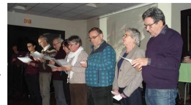
Témoignage des « voyageurs » de novembre 2017