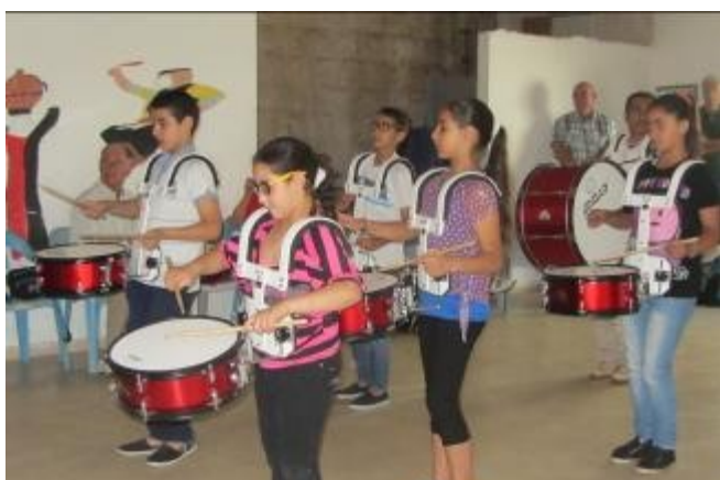
Les jeunes du quartier nous font une démonstration de « batucada » pleine de rythmes et de couleurs,