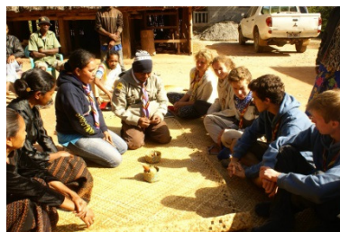
Rite traditionnel d'accueil des Scouts dans un village du Timor

Les nombreuses anecdotes qui émaillaient avec humour son récit ont permis aux jeunes de toucher du doigt le choc culturel.