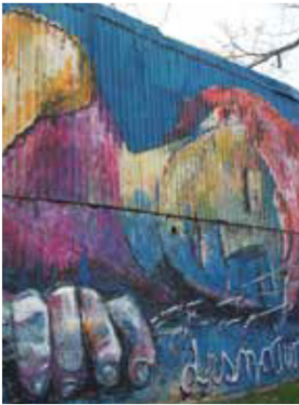
Libère-toi de tes chaînes Fresque de Guillermo Quevedo, Rosario-Argentine