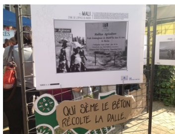
Stand CMR-CCFD-Terre solidaire à Alternatiba

Ce fut une journée positive et chaleureuse avec un seul mot d'ordre : « Les bonnes idées s'expriment et se partagent ».