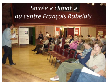
Soirée « climat » au centre François Rabelais