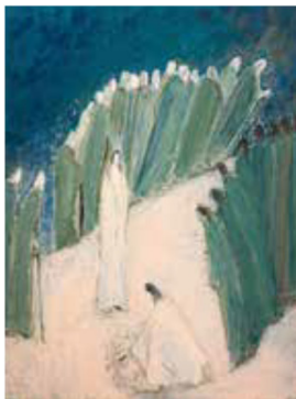
Femme adultère, personne ne t'a condamnée. Huile sur toile de Macha CHMAKOFF (Lyon - 69)

Jeudi 12 novembre , à 20h, à la Maison du citoyen, Terre des hommes et le CCFD-Terre solidaire animent un ciné-débat sur le thème :