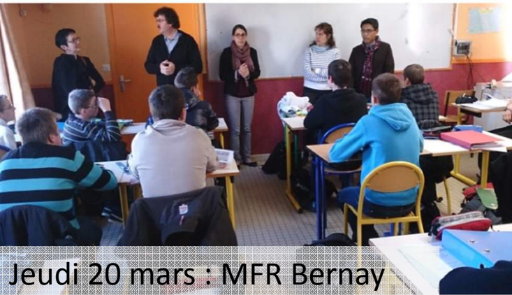
Jeudi 20 mars : MFR Bernay