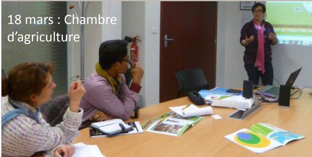
18 mars : Chambre d'agriculture