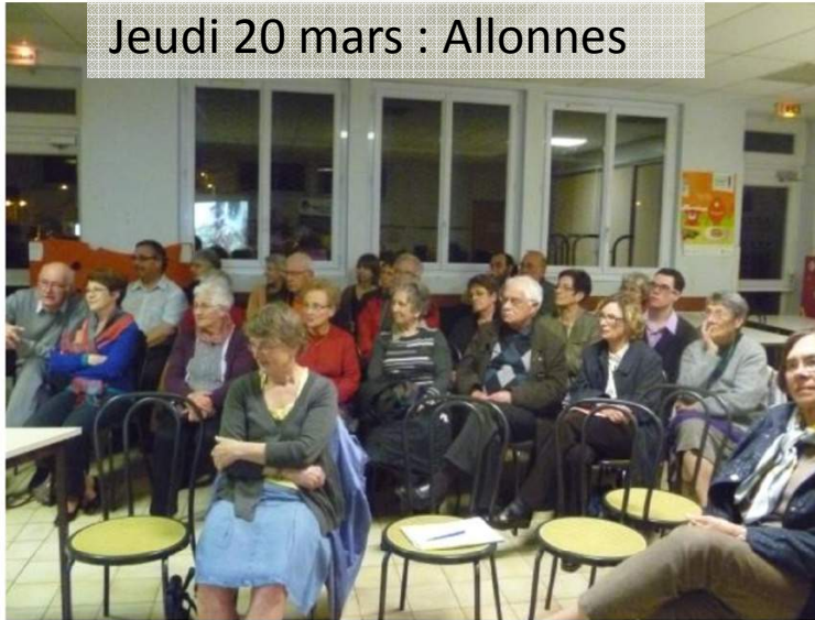
Jeudi 20 mars : Allonnes