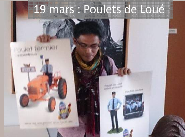
19 mars : Poulets de Loué