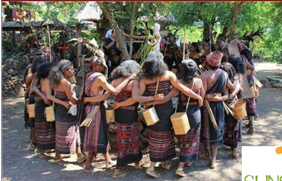
KAMI MENARI BERSAMA