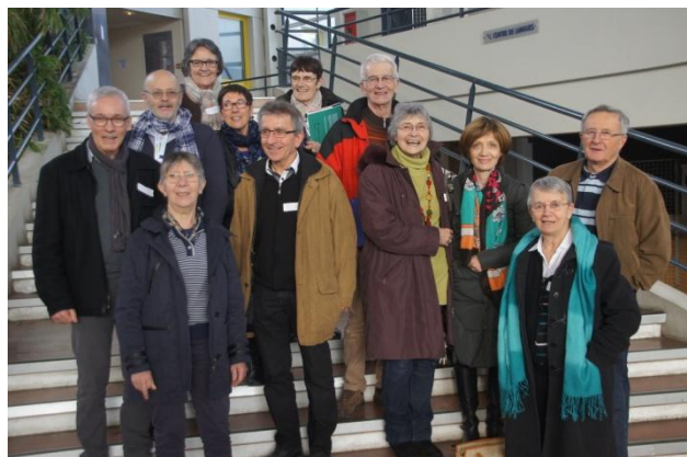
Manque sur la photo : Dominique MAGE

200 personnes venues des 9 délégations diocésaines du CCFD-Terre Solidaire en Bretagne-Pays de Loire, dont un petit groupe de 13 Vendéens, se sont rassemblées à la Faculté des lettres de Rennes. Après un "Questions pour un champion" en guise d'introduction, les participants se sont répartis dans des mini-débats portant chacun sur un des thèmes suivants : souveraineté alimentaire, migrations internationales, égalité Femme-Homme, justice climatique, finances solidaires, ... .