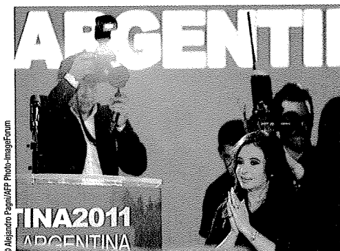
Cristina Fernández de Kirchner lors de son élection, le 23 octobre 2011.